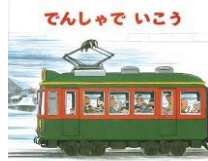
「でんしゃでいこう」 作・絵 間瀬なおたか ひさかたチャイルド

前から読むと、雪積る山の駅。小さな電車が出発します。「デデン ドン」村を抜け、山を登り、鉄橋を渡り…海の駅につきました。